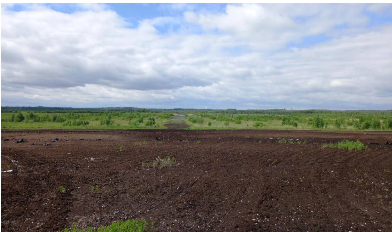
Kuva 3. Konnunsuon turvetuotantoalue, näkymä Kotasaarentieltä länteen (2022)