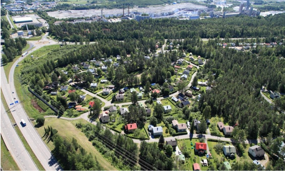
Viistoilmakuva Mattilan vanhimmasta osasta valtatie 6:n ja Vaali-maantien risteuksen kulmassa. Taustalla näkyy Nordkalk Oy Ab:n kaivosalue.

Asemakaavassa huomioidaan Mattilan omakotialueen paikallisesti merkittävä rakennettu kulttuuriympäristö, liito-oravan elinpiirin ydinalueet sekä muut alueen erityispiirteet.