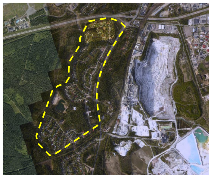
Ortoilmakuvayhdistelmä v. 2015 – 2017.

Alueella voimassa olevista asemakaavoista suurin osa on todettu vanhentuneiksi siihen nähden millaista rakentamista alueelle tulevaisuudessa halutaan ja miten alueen rakennettua kulttuuriympäristöä halutaan säilyttää. Suunnittelun tavoitteena on tiivistää yhdyskuntarakennetta olemassa olevan infraverkon alueella ja samalla säilyttää alueen ominaispiirteet. Lisäksi huomioidaan eri toimintojen laajenemistarpeet.