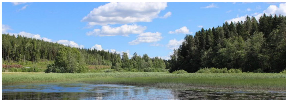
Kuva 3. Järvimaisema Vainikkalasta