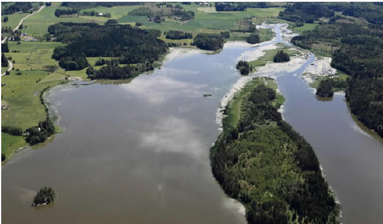
Kuva 2. Viistoilmakuva suunnittelualueelta.