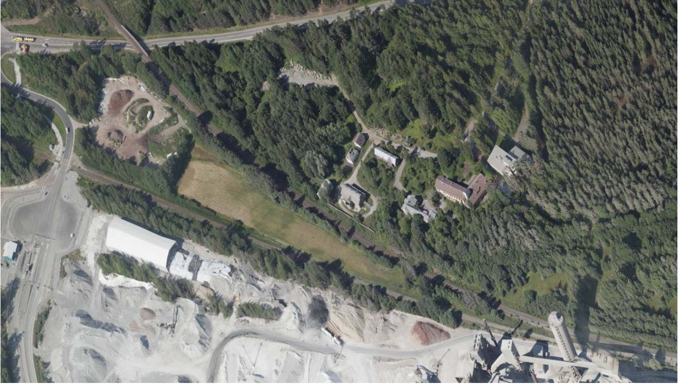
Viistoilmakuva alueesta