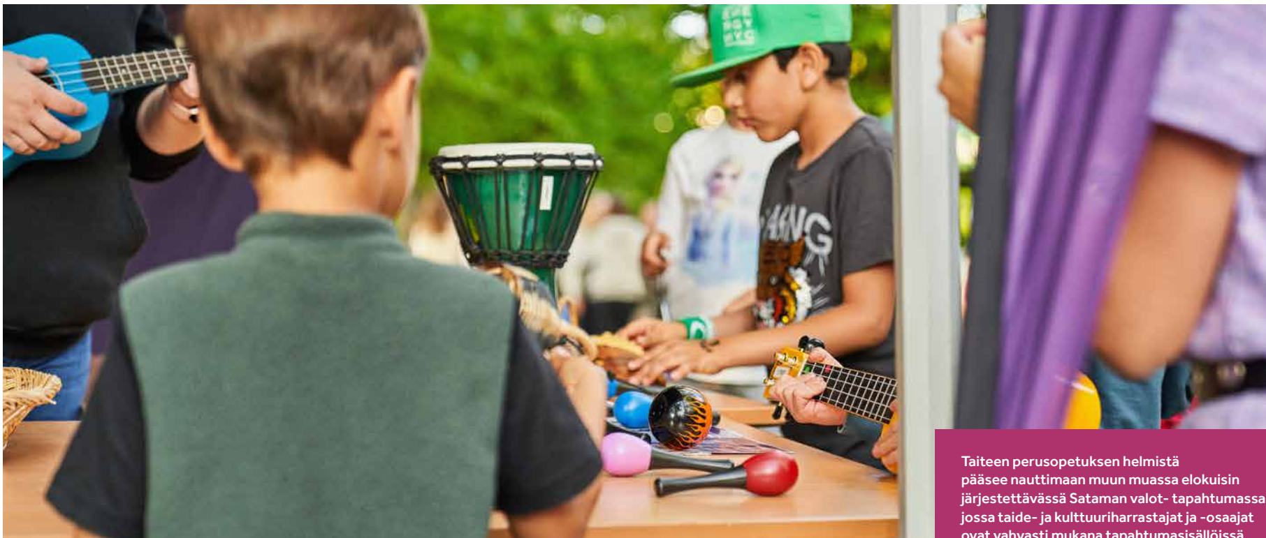
Toimittanut vastauksen pohjalta: Sami Soljansaar

Taiteen perusopetuksen helmistä pääsee nauttimaan muun muassa elokuisin järjestettävässä Sataman valot- tapahtumassa, jossa taide- ja kulttuuriharrastajat ja -osaajat ovat vahvasti mukana tapahtumasisällöissä.