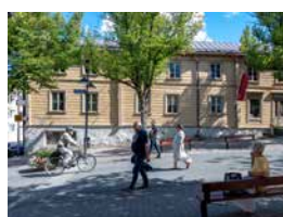
Wolkoffin talomuseoon voi kesällä tutustua myös omatoimisesti.