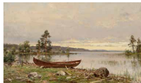
Hjalmar Munsterhjelm, Aikainen aamu Saimaan rannalla, Lappeenrannan museot, Viipurin Taiteenystävät ry:n talletus